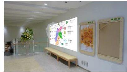
館内展開イメージ例 (レストスペース部に信州の各地域をイメージしたアイコンを展示)