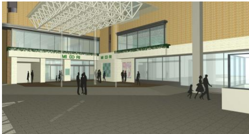
既存駅ビルエントランス部