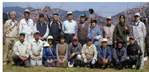
NPO 法人 信州・川中島平ファクトリー

傷が付きやすい農作物を優れた加工品にすることでフードロスの削減や農家支援、川中島白桃(桃)といった地域ブランドの振興に取り組む「NPO 法人 信州・川中島平ファクトリー」をはじめ、県内の様々な生産者団体と連携し、農業の活性化に取り組んでいきます。