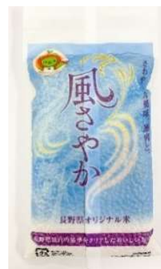
「風さやか」イメージ

「信濃の風」では月に一度、毎月最終土曜日に、その時期の旬でお薦めできる農産品のテーマを決めて販売する「信濃・産直フェア」を開催します。フェアにあわせて生産者や生産地域の紹介も行う予定です。当面の日程：7月31日、8月28日、9月25日