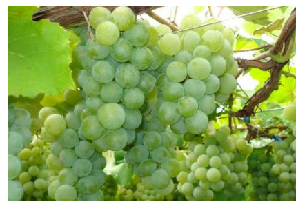
シャインマスカット